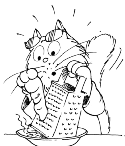
Maček Miki riba hren.