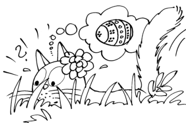
Muca Mira išče pirhe.