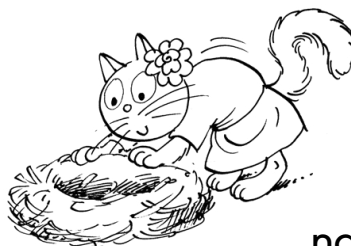
Muca Mira naredi gnezdo.