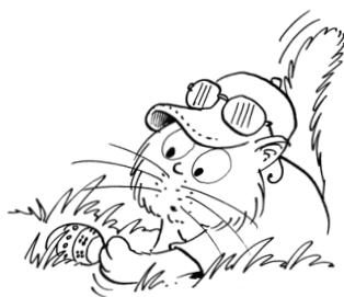
Maček Miki skrije pirhe.