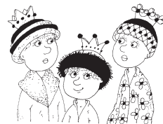
SV. TRIJE KRALJI